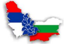
Bulgaria – Serbia IPA Cross-border Programme

Ова анализа је направљена уз помоћ средстава Европске уније кроз “ИПА Програм прекограничне сарадње Бугарска- Србија” под бројем ССИ No 2007CB16IPO006 Јединствено одговорно лице за садржај ове публикације је Сурдулички културни центар и ни на који начин не може бити тумачен као став Европске уније или Управљачког тела програма